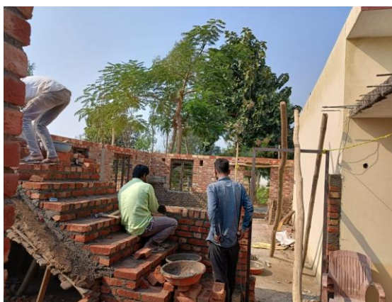
Det er et godt bygge hold med stor faglighed og ærlighed, - Principle er del af alle materiale indkøb –og står for betalingen.

I udvidelsen er der –et klasselokale til 6. Klasse, to lærertoiletter, et depotrum, et lille køkken, en trappe op til taget (her vil vi gerne bygge klasselokalet til 7.,8. klasserne) samt et kontor hvor der er plads til elev-, lærer- og forældre samtaler – det bliver flot og langsomt lever vi op til flere og flere af regeringens krav til skoler.