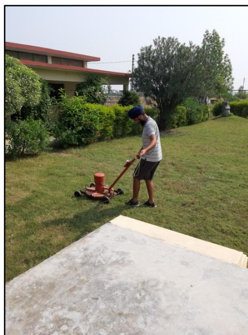
Der er mange slanger i området, derfor bør der ikke ligge bunker med sten og andet affald i skole området.. Græsslåmaskinen her er hjemmelavet, og lejes gerne ud...