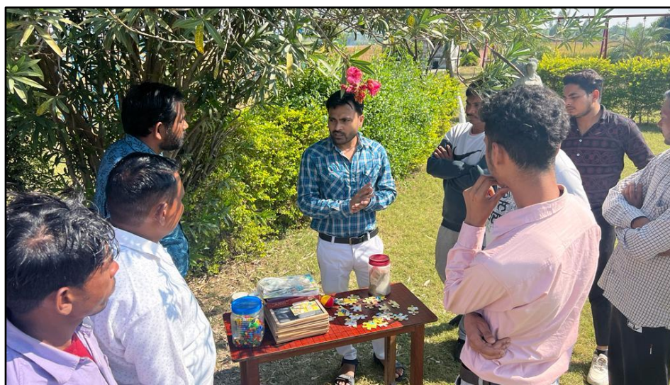
Lærerne fortæller og viser hvordan de underviser, og forældrene viste stor nysgerrighed.