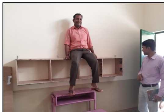
En af forældrene er snedker og lavede en god biblioteks reol til hver klasserne, en del af projekt: "ONE BOOK A DAY"

Vi fik ansat en altnuligmand, -skolen har en maid ansat, og hendes mand har hjulpet med nogle små opgaver og han var meget interesseret i et job på skolen, - Vi bad ham om selv at lave en jobbeskrivelse, -det viste han sig at være god til – der er nok for ham at lave, bl.a. overtager han gartneropgaven – som altid har været en stor udgift. Siden har der vist sig mange opgaver han kan varetage.